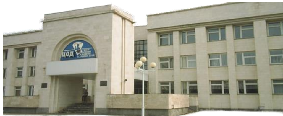
Лицей - интернат «Центр одаренных детей»